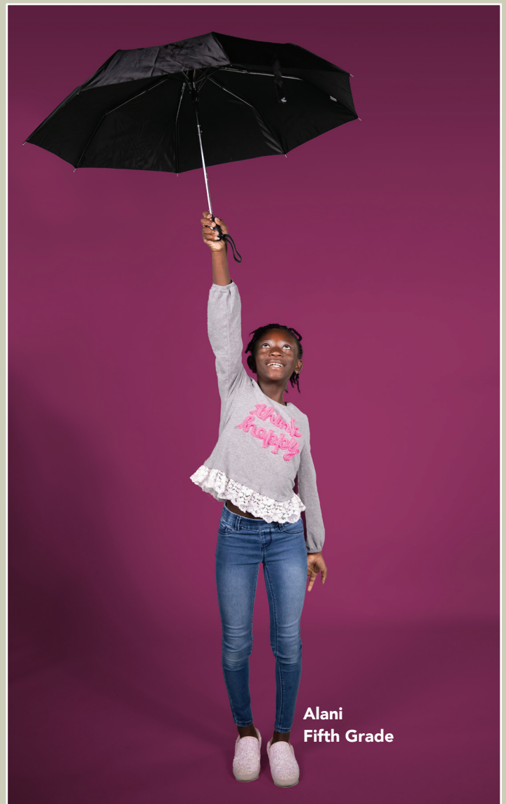
Alani Fifth Grade

Aplicaciones de programas pueden tener interrupciones de vez en cuando por actualizaciones o falla inesperada. Se dará notificación de antemano de interrupciones planeadas durante horas escolares.